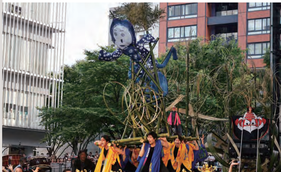
日本元気プロジェクトの参加